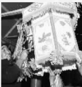
■黄河阵门口悬挂的彩灯,包括上边贴的剪纸完全由村民手工制作。

第三,由擅长书籍排版的美编重新选图、设计,部分图首次亮相,图片更具视觉冲击力,版式更加古朴、厚重、美观。本书分上下册,大32开,共900余页,初步定价80元,们继续接受读者预订。预订方式:发短信至13073193569,订书人姓名(或单位名称)、地址、预订套数。