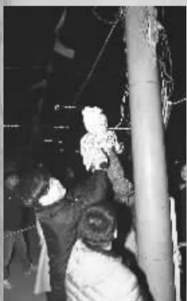
■抱起小娃娃摸天灯竿。