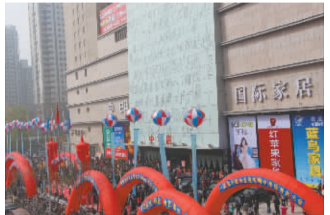
■开业现场热闹非凡。

各店的特色活动也不少。2014年10月-2015年3月交房的业主,在东明高端旗舰店北杜店可享专属团购,进店畅享三重乔迁礼上礼(进店礼、现金礼、实惠礼)。如果购买建材,金利来店3月28日的“任性5小时”最合适不过。另外,建华店、东二环店、西二环店也准备了红包、现金券、礼金券等多重优惠,让您体验到购物也能赚钱。