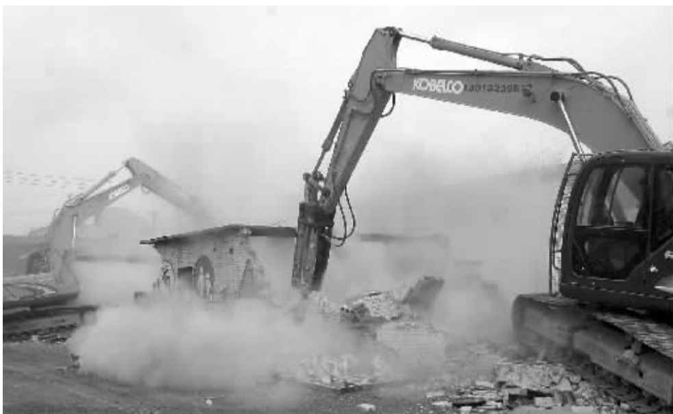
挖掘机铲下第一铲。

冀纯堂在讲话中指出,城中村改造是盘活城市存量土地的重要基础,是招大商、引巨资、大气魄加快现代化城市建设的重要载体,是改善群众居住环境、提高市民幸福指数的重要抓手。可以说,城中村改造是实现“每年一大步、三年大变样”的重中之重,实现省会“三年大变样”,首先是城中村大变样。搞好城中村改造,是一项