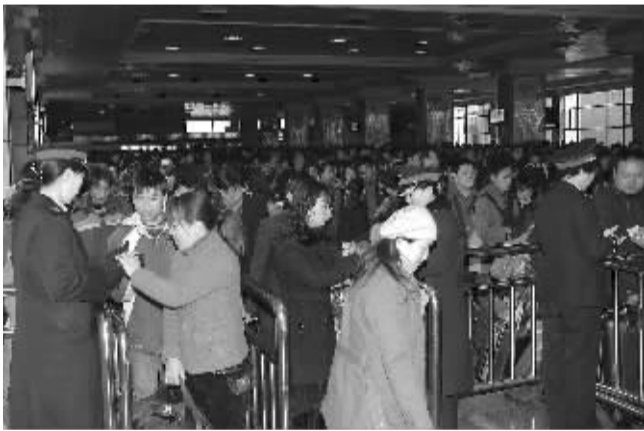
旅客有序通过检票口。

从该站车票预售情况来看,未来两日,高峰客流将迅速回落,车站将恢复到日常运输状况。