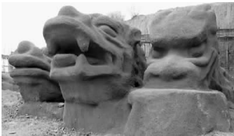
形态各异的石龙(龙头因破损进行过修复)。

有关专家曾对这个石龙群进行了考证,但其形成原因、产生年代等问题至今仍未查清,甚至其应属地质现象还是人文遗迹,至今也没有定论。但也有文物专家猜测,由于发现石龙的地方距赵王陵遗址仅1公里,极可能为赵王陵的“镇陵之物”。另据勘测,组成这个石龙群的石材,距今已有数万年历史,且其石质非常特殊,方圆20公里内未发现同种石料。